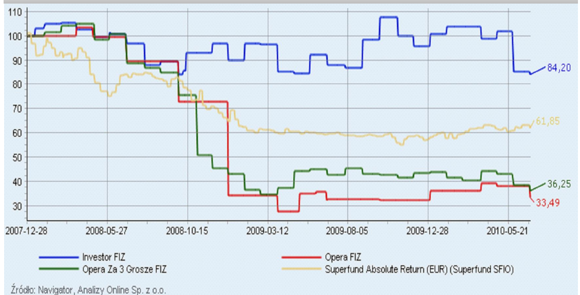
Przebieg inwestycji w wybrane fundusze absolute return od końca grudnia 2007 roku