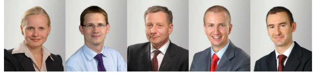
Zespół zarządzający Funduszami Inwestycyjnymi Arka

Naszą filozofię w skrócie można ująć następująco: inwestujemy w spółki, a nie w akcje. Podejmując decyzję inwestycyjną, inwestujemy tak, jakbyśmy mieli stać się współwłaścicielem w prowadzonym przez spółkę biznesie. Dlatego inwestujemy w spółki, w które naszym zdaniem warto inwestować na lata.