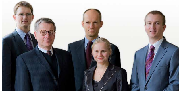
Zespół zarządzający Funduszami Inwestycyjnymi Arka

Naszą filozofię w skrócie można ująć następująco: inwestujemy w spółki, a nie w akcje. Podejmując decyzję inwestycyjną, inwestujemy tak, jakbyśmy mieli stać się współnikiem w prowadzonym przez spółkę biznesie. Dlatego inwestujemy w spółki, w które naszym zdaniem warto inwestować na lata.